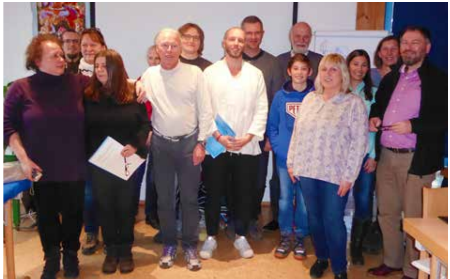
Die ersten Gruppe der Alchymistischen Lebens-Energie-Beraterinnen und Berater freut sich über das erste Etappenziel im weiteren alchymistischen Werdegang: das LEB®/A Diplom.

Diplom gipfeln. Und da wären wir bei der Eingangsfrage, denn am 9.-11.02.2018 fand zum ersten Mal Modul 5 der Ausbildung zum Alchymistischen Lebens-Energie-Beratersstatt, was dem Abschluss der ersten LEB®/A-Seminarreihe gleichkommt.